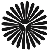
دانشگاه پیام نور