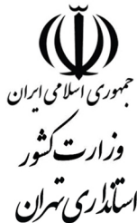
جمهوری اسلامی ایران وزارت کشور استادری تهران